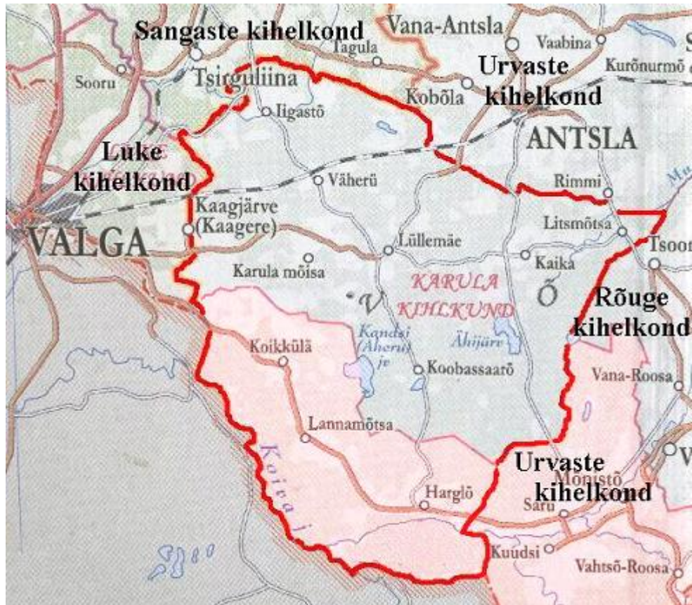
Keskaegsete piiridega Karula kihelkond (aluseks: Reimann 2004).

(Punasega on märgitud ala, millest moodustati 1694. aastal Hargla kihelkond)