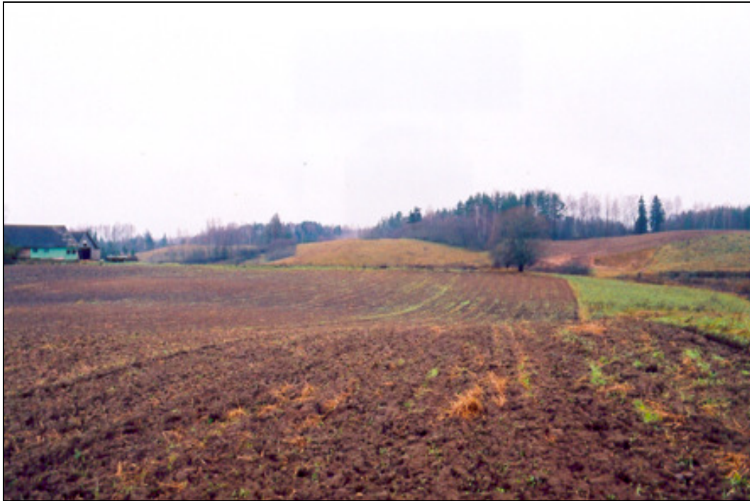
Joonis 7. Vaade asulakohale ida suunast.