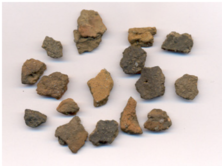
Joonis 8. Käsitsi vormitud keraamika Jaugamõisa asulakohast. (TÜ 1252: 12; 13)

Asulakihi pinnaseire käigus kogutud leimaterjali nimekiri on esitatud tabelina aruande lisas. Kokku leiti 60 savinõukildu. Neist 18 pärinevad käsitsi vormitud nõudest. Seitsme killu puhul on raske otsustada, kas tegemist on olnud käsitsi või kedral vormitud nõuga, kuid ilmselt kuuluvad needki samasse perioodi käsitsikeraamikaga. Kuna käsitsikeraamika kildude hulgas servatükid puuduvad ning enamik kildudest on väikesed