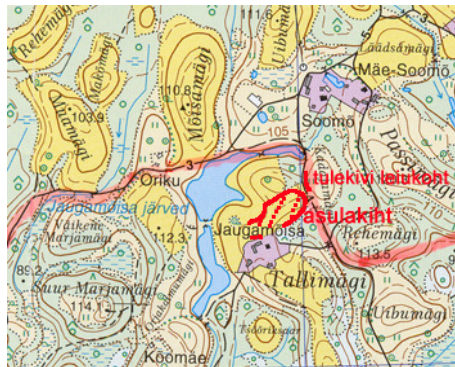
Joonis 3. Jaugamõisa asulakoht ja mesoliitiline leiukoht. (1:20 000)

Arheoloogiliste välitööde tulemusena selgus, et tänapäeva Jaugamõisa talu maal on säilinud ajaloolisele asustusele osutav kultuurkiht, mille leiumaterjal kuulub mitmesse ajaperioodi. Vastav muistis nimetati Jaugamõisa asulakohaks ning selles eristati kolm kihtmuistist.