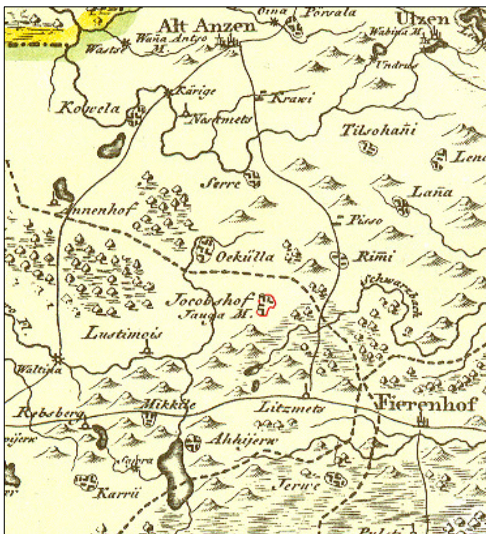
Joonis 1. Jauga mõisa asukoht 1798. a Mellini kaardil. Suurendatud 1:2.

Arheoloogilised uuringud Jauga mõisa oletataval asukohal viidi läbi seoses Karula Rahvusparki ning Karula Hoiu Ühingu projektiga, mille käigus uuritakse Jauga mõisa