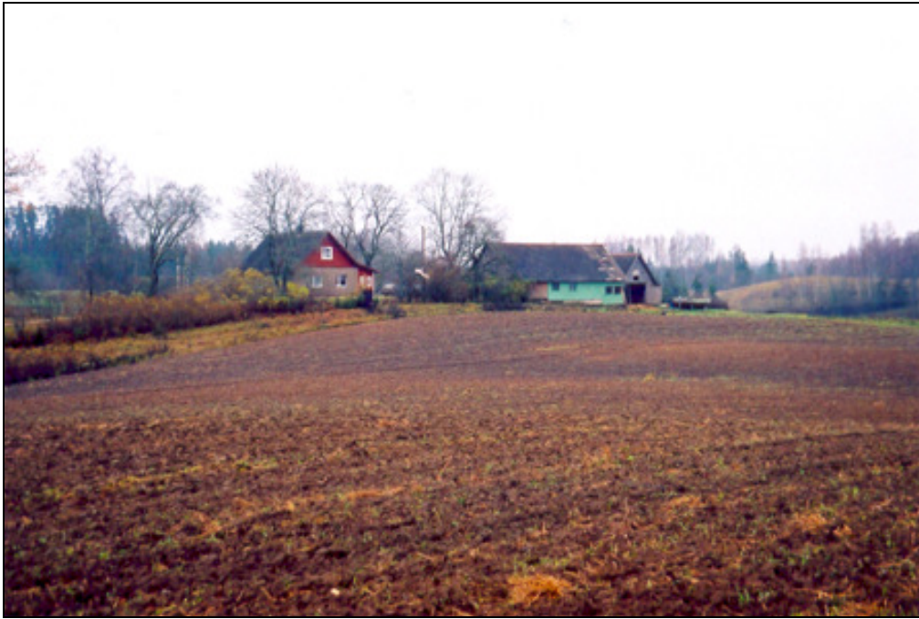
Joonis 6. Vaade asulakohale kirde suunast. Kultuurkiht eristub fotol tumeda alana tavalise helepruuni põllumulla taustal.

põllunõlval. Künka kõrgemal osal oli kiht veidi nõrgem. Põllumassiivi kirdeosas esines kihti vaid laiguti. Kultuurkihi suurem paksus alanevatel nõlvadel on osaliselt tingitud põlluharimise tulemusena tekkinud erosioonist. Kultuurkihis esines kivi purdu ja põlenud kive, mis tõenäoliselt pärinevad kerisahjustest. Kihis oli väga vähe tellisetükke ning kõik needki olid ilmselt tänapäevase ehitustegevuse jäänukid. See osutab, et ajaloolised ehitised olid puidust ning varauusaegset või uusaegset tellishoonet pole antud asulakohal olnud.