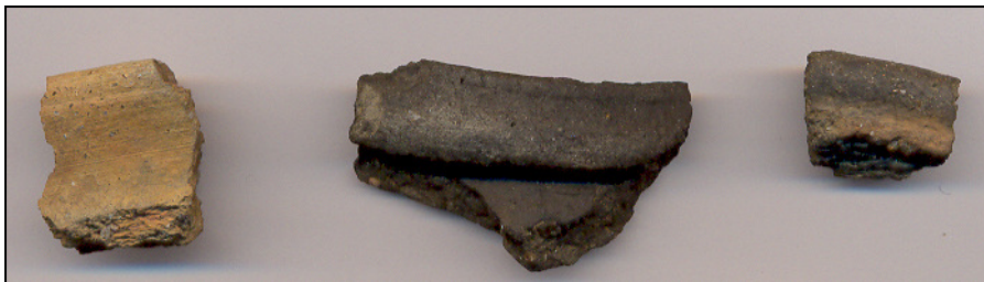
Joonis 9. 17.-18. sajandi kdrakeraamikat Jaugamõisa asulakohalt.

enamik kuulub nõudele, mida Lõuna-Eestis laialdaselt kasutati 17.–18. sajandil (joon 9). Sellistele nõudele on iseloomikult lühike väljapoole keeratud võrik. Nõud on lihtsad ning dekoreerimata.