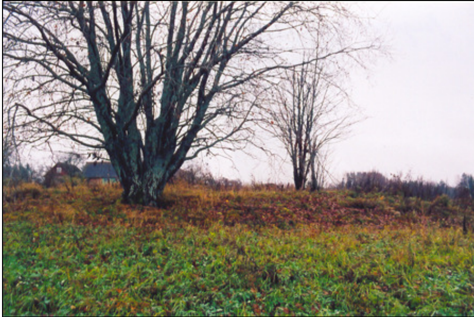
Joonis 4. Vaade talust loodesse jäävale kivivundamendile põhja suunast.

talude laudahoonest umbes 90 m kaugusel võis maapinnal märgata mingi kivivundamendi jäänuseid (joonis 4). Selles paigas olnud hoone on märgitud hoone ka Vene 1949. a sõjaväekaardile (joonis 5) ning oli veel 20. sajandi I poolel kasutuses.